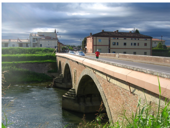
Foto 3 - Passaggio lungo il ponte Romano di Torri di Quartesolo lungo la SS 11.