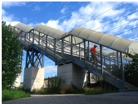
Foto 4 - Viadotto pedonale sulla direttrice ferroviaria Milano Venezia lungo Strada Paradiso a Bertessinella