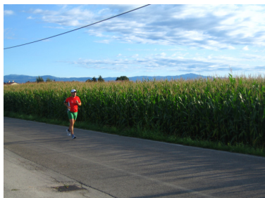
Foto 1— Via Alture la bellissima via di campagna che collega Marola a Lerino

• VIA ALTURE: IMMERSI NELLA CAMPAGNA Ci aspettano 3 km di pura gioia di correre immersi in una via di rara bellezza tra l'aperta campagna vicentina tappezzata da campi di mais con incastonate qua e là delle ville da sogno (Foto 1). La strada è stretta ma poco trafficata, sembra studiata appositamente per noi runners, presenta lunghi rettilinei alternati da divertenti tratti tortuosi. Continuiamo a seguire la strada avendo come riferimento il campanile della chiesetta di Lerino che a grandi passi si avvicina all'orizzonte. Al km 4 raggiungiamo il centro di Lerino, giriamo a destra attraversando il piazzale della Chiesa e concediamoci una sosta lungo un bellissimo viale pedonale alberato che presenta la prima fresca fontanella (Foto 2).