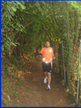
Corse nel verde

La domanda di questi giorni è questa: siamo ancora in estate? Per molti le vacanze devono ancora iniziare ed il tempo e le temperature sono quasi autunnali. Ci consoliamo con temperature ottime per correre!