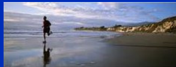
Siete runner cerebrali?