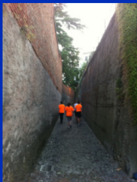
Corse in salita

Si respiraaaaa! Yes I can breathe! Break nella rovente estate con una settimana all'insegna della instabilità. Martedì fortemente perturbato, migliora il giovedì per poi ritornare instabile il weekend. Minime in discesa in ZONA VERDE! Max in discesa in ZONA ARANCIONE ma più sopportabili grazie alla diminuzione dell'umidità. Tendenza fine settimana: Instabilità con temperature molto più fresche, domenica massime primaverili sotto i 25°C! Condizioni ideali per correre!