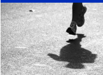
Il running è come volare!

La mente che frena, a volte con la complicità di un severo avversario interno, in fondo non fa altro che riprodurre tutte quelle insicurezze e paure che abitano una parte di voi e che si manifestano non soltanto nel running, ma spesso in molti altri aspetti della vostra vita. Dunque pensare positivo significa provare a modificare gli schemi, le paure, le incertezze più dannose della mente che frena, che nella corsa si manifestano attraverso blocchi mentali. "Posso fare questo, non quello", "Non riuscirei a correre la maratona", "Ho abbassato i miei tempi, più di così mi è impossibile"...ecco una serie di frasi e pensieri scoraggianti. Pensare positivo significa pensare di poter cambiare le sorti di queste affermazioni, come dice Jeff "Yes you can do this!"