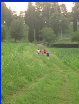
Corse nella natura