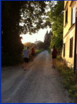
Corse nella natura