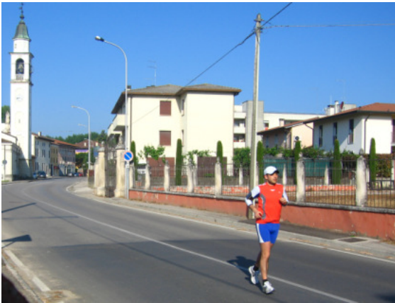
Foto 3 - Passaggio lungo il centro di Monticello Conte Otto