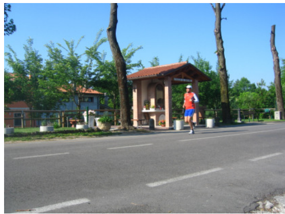
Foto 4 - Il bellissimo capitello e l'oasi dedicata a Padre Pio in località Lisiera