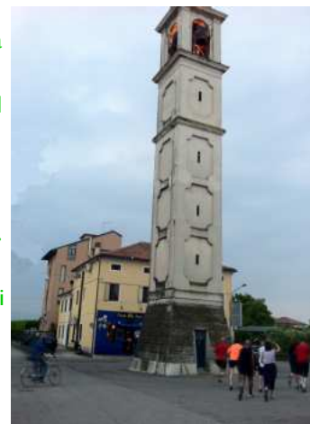
Foto 2 - Il giro del campanile di Polegge

• LA VARIANTE: Arrivati al campanile di Polegge, invertite il senso di marcia, al termine della ciclabile, girate a destra e percorrete tutto il quadrilatero di Laghetto. Vi ritroverete, in Via Lago di Como parte terminale del percorso principale. La variante misura 6,5 km.