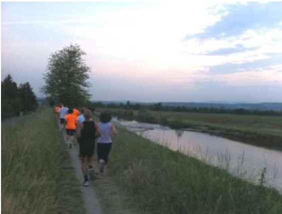
Foto 3 - L'argine del fiume Bacchiglione con la cascatella e le amene spiaggette