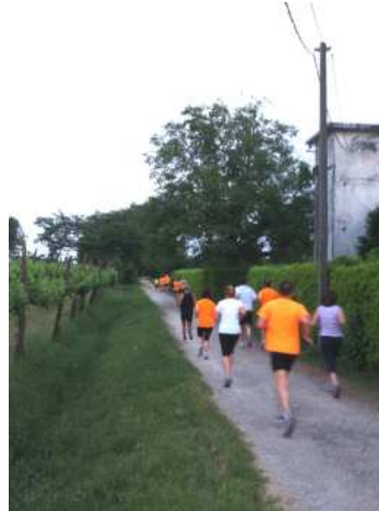
Foto 4 - La bellissima strada sterrata parallela alla strada di Ponte Marchese